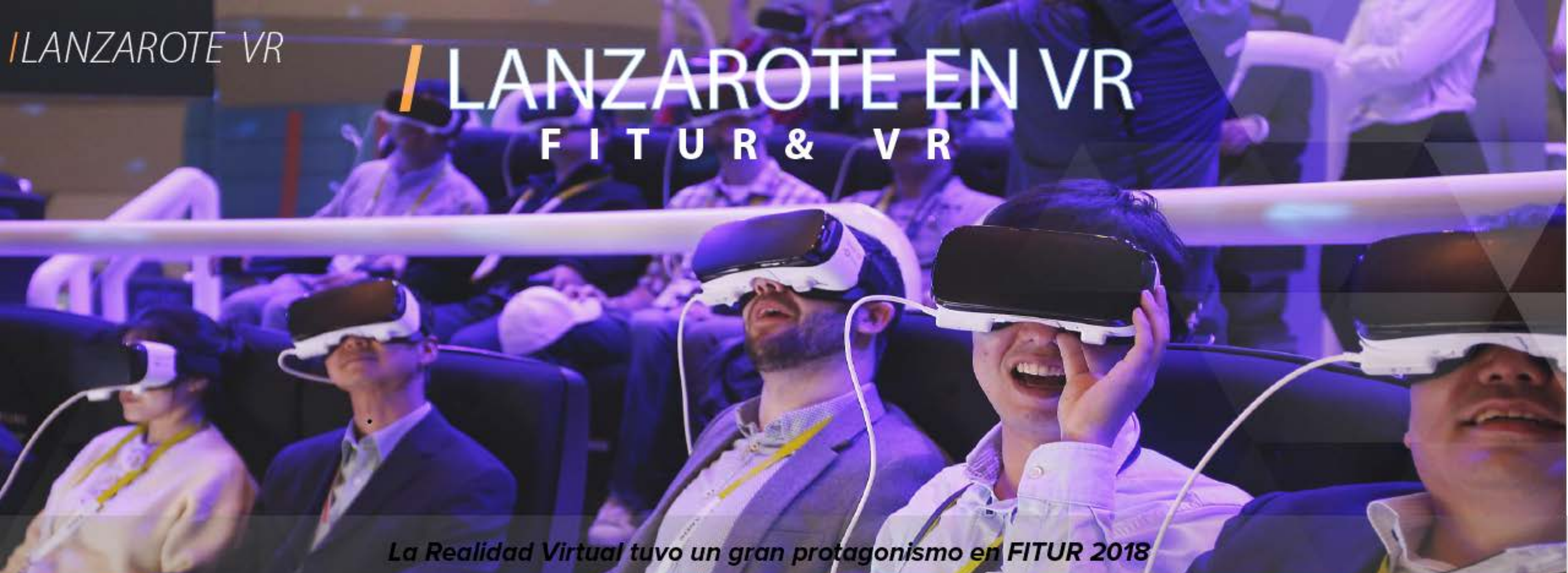
La Realidad Virtual tuvo un gran protagonismo en FITUR 2018